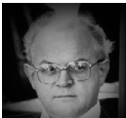
Professeur Désiré COLLEN